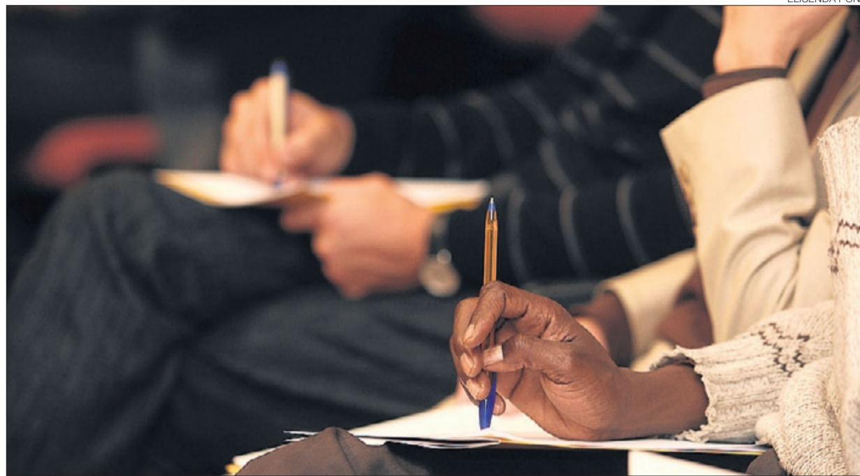
▶▶ Detalle de algunos de los asistentes a la jornada sobre inmigración en el IEMed, ayer